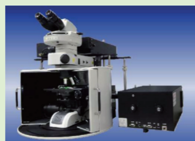
医薬品やバイオへの適用が期待される共焦点ラマン分光装置