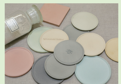
吸水力や消臭、抗菌、防カビにも優れたカルシウムセラミックス