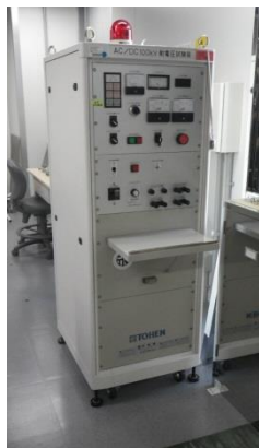
交流発生器・直流変換器 制御盤